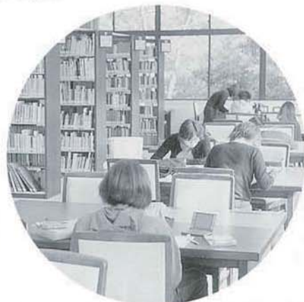
書籍・AV資料 豊富にそろい平日は 7時迄利用できる 図書館