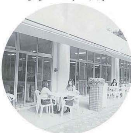
2003年春リニューアルした リリー・イースト